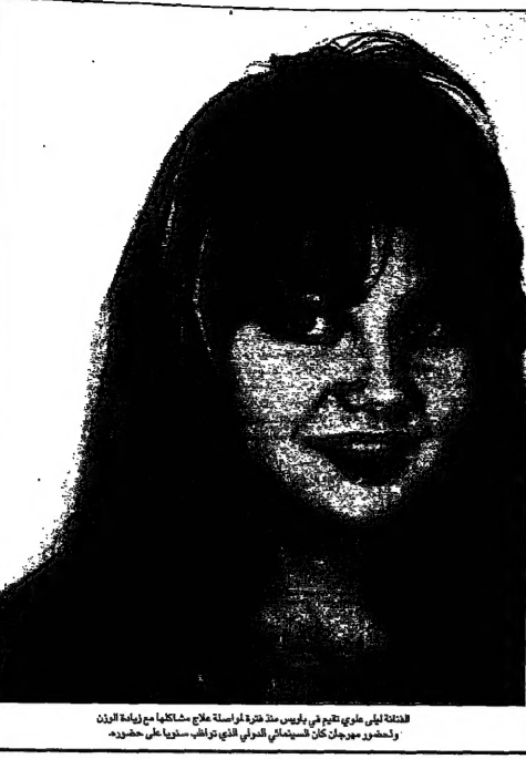
المرأة الجزائرية التي قتلها في عمان، وهي من سكان القلعة.

عمان - قتل مواطنة جزائرية في عمان، وذلك بعد تعرضها لهجوم مسلح في منطقة القلعة. عمان - قتل مواطنة جزائرية في عمان، وذلك بعد تعرضها لهجوم مسلح في منطقة القلعة.